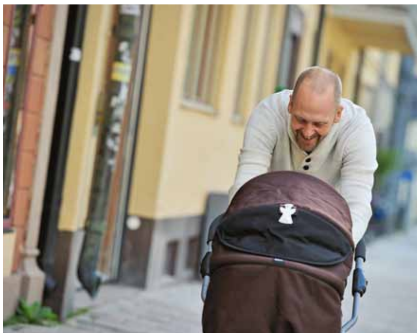
Pappadagarna i föräldraförsäkringen är ett av de senaste tillskotten i Sveriges sociala trygghetssystem.