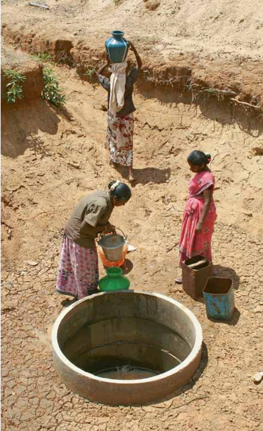
I program för beredskapsarbeten i Indien och Etiopien får kvinnor ofta utföra "lätt arbete", som att bära sten och hämta vatten. Varför detta anses vara "lätt" är oklart. Sociala trygghetssystem kan öka jämställdheten om de utformas på ett medvetet sätt. Bilden är från Indien.