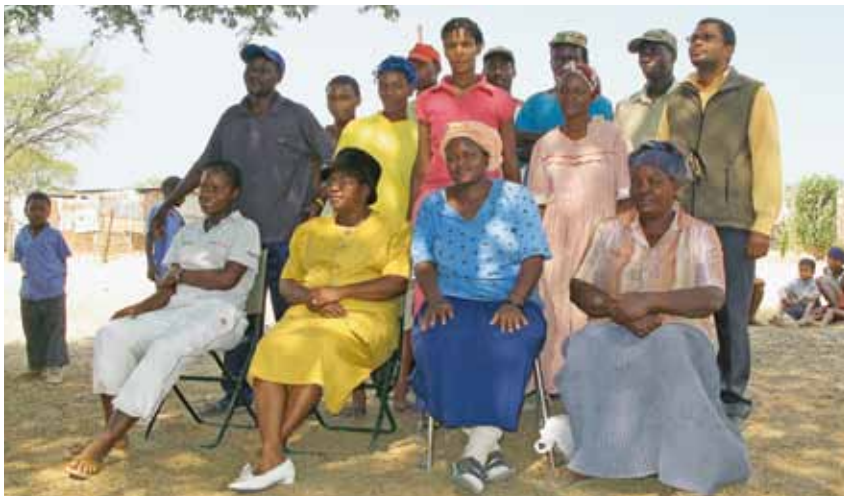
Medlemmar i BIG-kommitten (BASIC INCOME GRANT) som genom två års ovillkorat kontantstöd dramatiskt minskade andelen undernärda barn i byn Otjivero i Namibia.