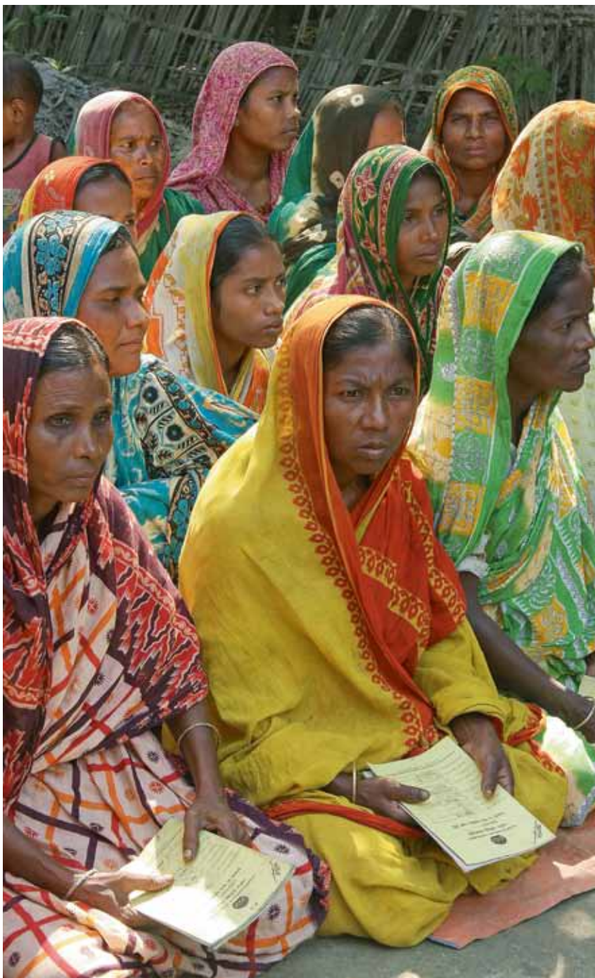
Med sin lokala närvaro kan det civila samhällets organisationer delta i genomförandet av sociala trygghetssystem. Rangpur Dinajpur Rural Service, RDRS, har varit Svenska kyrkans partner i Bangladesh i mer än 35 år. RDRS kanaliserar ett statligt finansierat stöd till de allra fattigaste genom sin mikrofinansorganisation.