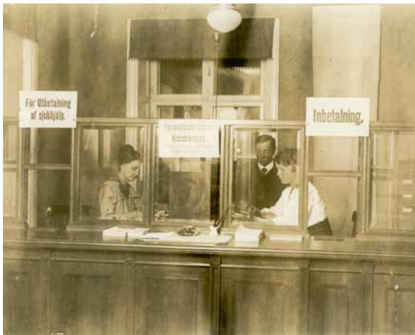
Sjuk- och begravningskassan Blomkronans expedition i Stockholm, 1918. Foto: Arbetarrörelsens arkiv och bibliotek (ARAB 2741.001)