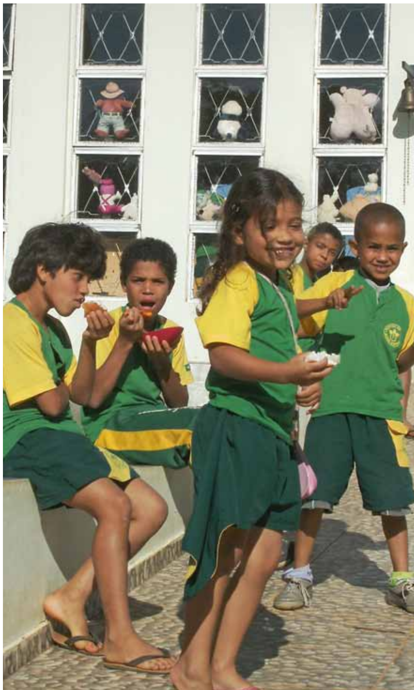
Brasilien är ett av de länder som har infört ett socialt trygghetssystem, familjebidraget BOLSA DE FAMILIA. Mycket talar för att sådana system bör ses som något som skapar långsiktig utveckling. På bilden skolbarn i Brasilien.