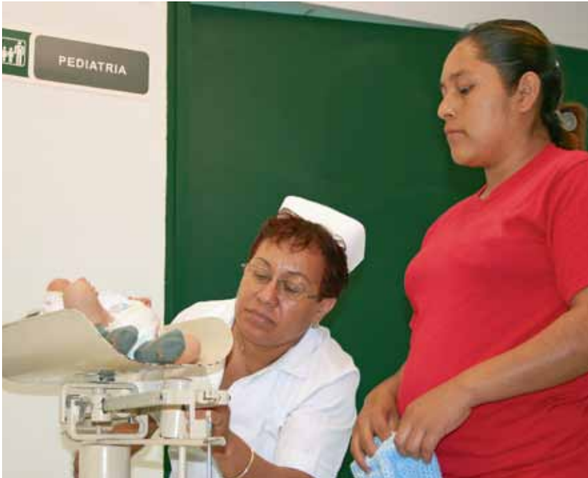
I Mexiko ges familjebidraget Oportunidades på villkor att föräldrarna tar sina barn till hälsoklinik. Programmet omfattar cirka 5,5 miljoner familjer. På bilden väger en sjuksköterska en bebis.