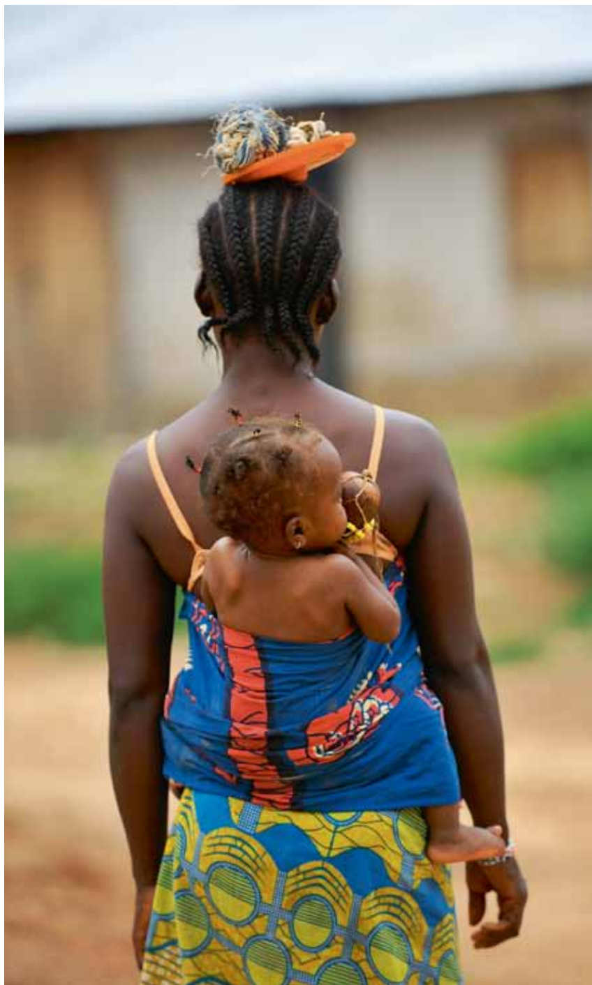
Det finns starka bevis för att kontantstöd ger förbättrad näringsstatus, speciellt hos barn. På bilden mor och barn i byn Boi, Liberia.