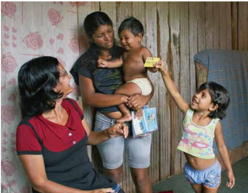
Det brasilianska familjebidraget Bolsa de Familia har bidragit till att hunger och fattigdom har minskat snabbt i Brasilien. På bilden en av cirka tolv miljoner familjer som får stöd genom programmet.