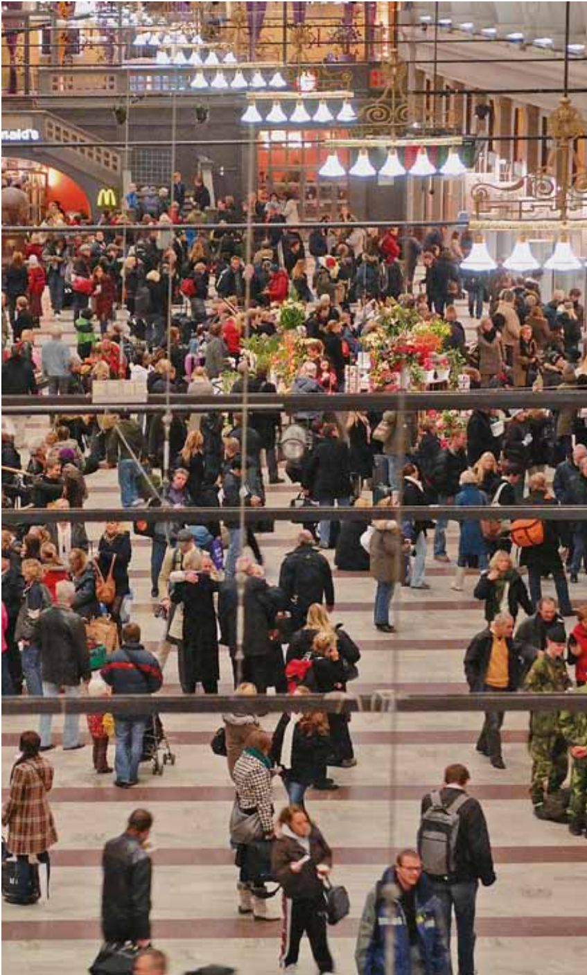
För de allra flesta svenskar spelar de sociala trygghetssystemen en viktig roll i flera skeden av livet. Det finns en bred politisk enighet om de grundläggande dragen i välfärdsmodellen.