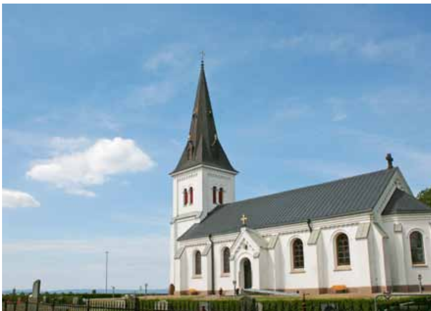
De lutherska tankarna innebar att Gud verkar på olika sätt i kyrkan och samhället. Ändå hade kyrkan länge ett stort inflytande över skola och fattigvård.